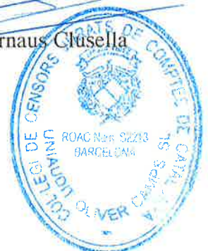
Joaquim Arnaus Clusella